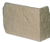
Chaîne d'angle 25