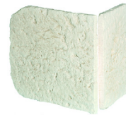
Demi chaîne d'angle MANOIR