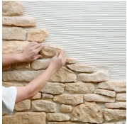
1 - Je pose

Utilisez exclusivement les produits ORSOL, ils vous assurent un travail bien fait et vous offrent la garantie produit ORSOL. Ne jamais utiliser de produits à base d'acide pour la pose ou l'entretien.