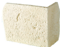
Chaîne d'angle MANOIR

Conditionnement en paquet de ± 0.5 m 2 joints compris de ± 2 cm