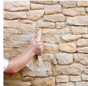
2 - Je réalise les joints