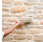
2 - Je brosse et j'hydrofuge

MATERIEL NECESSAIRE : Peigne 9x9x9, truelle, niveau, crayon, seau, malaxeur ou colle ORFLEX, Mortier joint ORSOL, poche à joint, brosse d'acier douce, pulvérisateur si pose en extérieur.