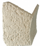
Arc de porte MANOIR